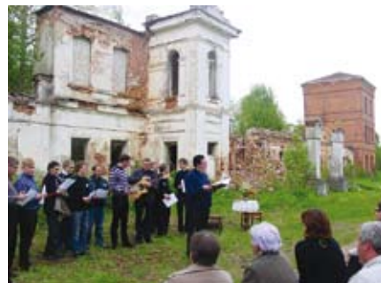
Vašuokėnų dvaro liekanos, pasitikusios jaunuosius dvasininkus 2012 m.