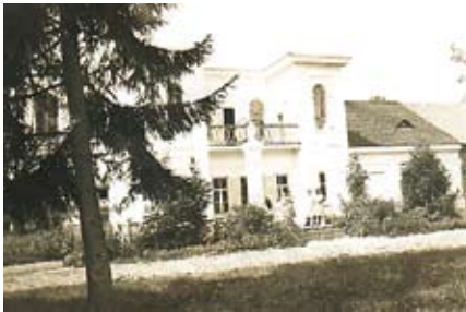
Vašuokėnų dvaras XX a. pradžioje.