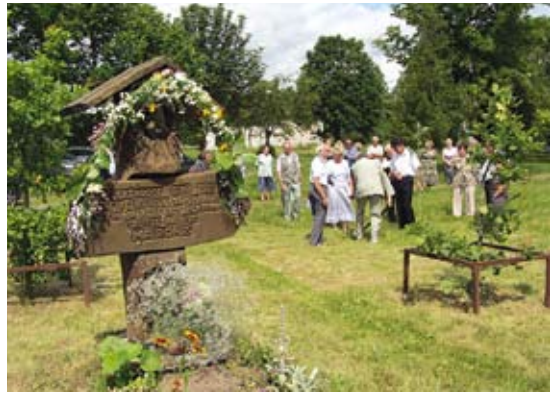
Aplink stogastulpį-rodyklę Maironio pėdsakams Vašuokėnuose atminti kyla jaunas ažuolynas.