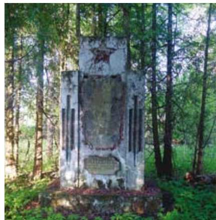
Paminklas nužudytiesiems Vašuokėnų dvarvietėje.