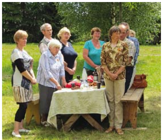
Užstalės po liepomis sujungia Vašuokėnų ir aplinkinių kaimų gyventojų kartas.