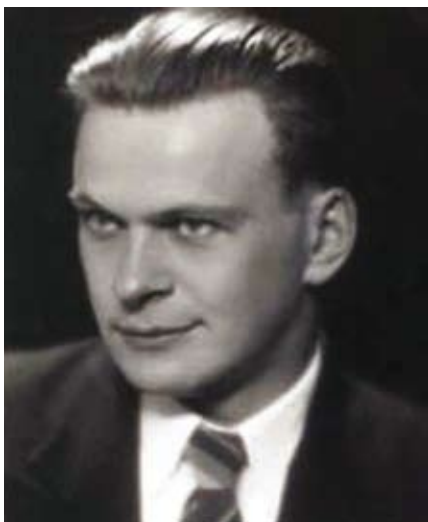
Buvęs Vašuokėnų pradžios mokyklos mokinys rašytojas Kazys Inčiūra.