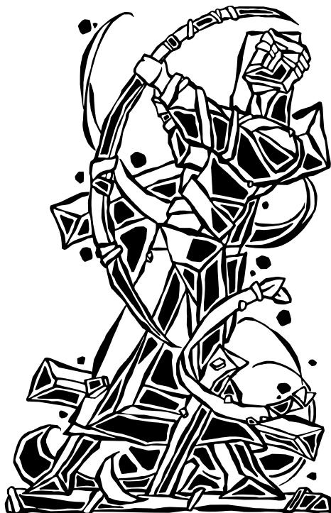
Adomas Matuliauskas. Šilkografijos darbų ciklas „Kaukysos kaukai“ „Medinčius“, šilkografija, (S/1), formatas 14,5 × 22,5 cm, 2016 m.