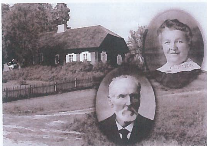
Griežionėlėse 1968 m. įkurta Didžiulių šeimos sodyba-muziejus.

Anykščių viešosios bibliotekos Vaikų literatūros skyrius (dabar – Vaikų literatūros ir edukacijos skyrius), atgaivindamas L. Didžiulienės laikų tradiciją