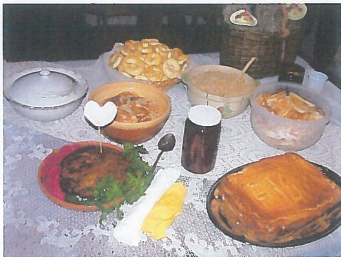
Lietuviški patiekalai, pagaminti pagal receptus iš L. Didžiulienės-Žmonos knygos „Lietuvos gospadinė“. Didžiulių sodyba Griežionėlėse, 2009 m.